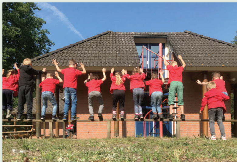
Bij Scouting Sint Patrick draait alles om uitdaging en plezier.

"Behalve de warme band met het gilde zetten we ons ook in voor de pronkzittingen van d'n Uutloot. Tijdens het 75-jarig bevrijdingsfeest in september hebben we de kransen gelegd. Al jaren