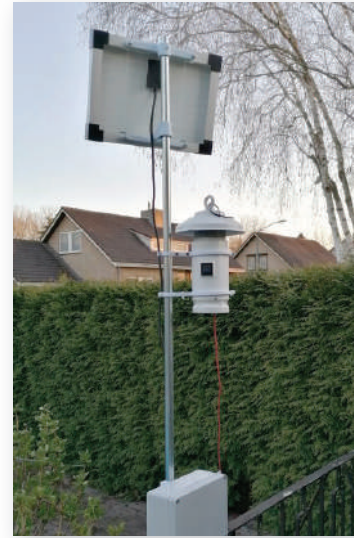
Meetstation voor fijnstof.

Er is bij de gemeente intussen door BWLvC subsidie aangevraagd om ook een jaar lang ammoniak en stikstofverbindingen te gaan meten op dezelfde tien plaatsen. De dichtstbijzijnde fijnstof- en stikstofmeetpunten van het RIVM zijn in Vredepeel en Nijmegen. Intussen wordt gewerkt aan een tweede serie van tien meetstations, zodat een fijnmazig meetnet ontstaat dat een goed beeld geeft van de luchtkwaliteit in de gemeente. Voor meer informatie: www.bwlvC.eu of stuur een e-mail naar informatie@bwlvC.eu .