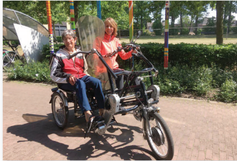
De duofiets van De Huuskamer is coronaproof gemaakt, zodat deze ook in het 'nieuwe normaal' gebruikt kan worden.