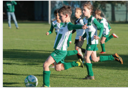
DSV-jeugd in actie.

de jeugdteams al lemaal de wei in kunnen. En inmiddels mogen ook de seniorenteams hun conditie op peil brengen. Eindelijk weer een balletje trappen. Heerlijk!” DSV is volgens het bestuurslid alweer bezig met het nieuwe seizoen. “Met creativiteit maken we er het beste van. Het grootste gemis is het sociale contact met de spelers en alle betrokkenen. Het samen sporten, lachen en genieten.”