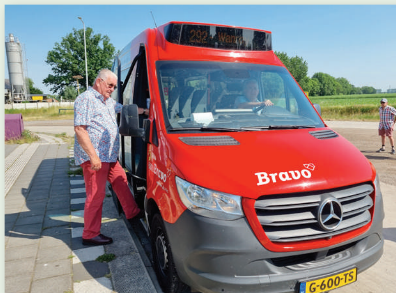
De buurtbussen worden gereden door vrijwilligers.