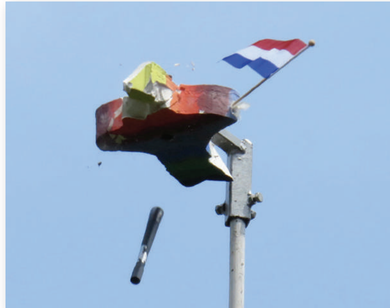
De vogel mag eindelijk weer de lucht in voor het koningschieten.

beneden weet te halen, is het komende jaar de gildekoning van Sint Tunnis!