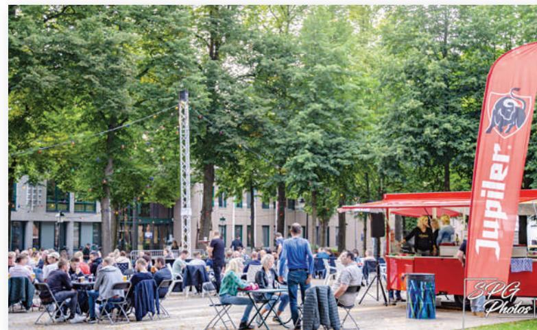
Gezelligheid op het gezamenlijke terras afgelopen zomer.

thousiast. "Sint Tunnis is een relatief klein dorp, maar ook hier laten we zien dat we groot kunnen zijn, als we maar samen voor hetzelfde doel gaan. En dat gebeurt, met onder andere het Tobtoernooi, 't Cafeetje, de 3 Burgemeesters, Friends en het Brinkteam. De eerste stap naar de 'Bruitende Brink' is gezet. Ik zeg: laat de zomer maar komen!"