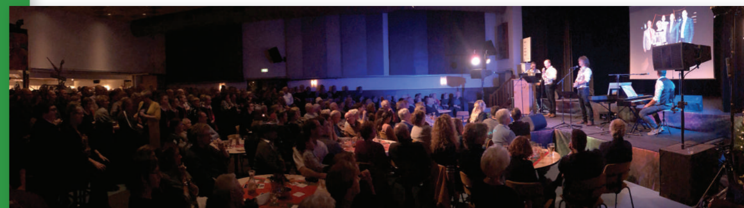
Nieuwjaarsborrel 1 januari met het cabaret 'lets van NIKS'.