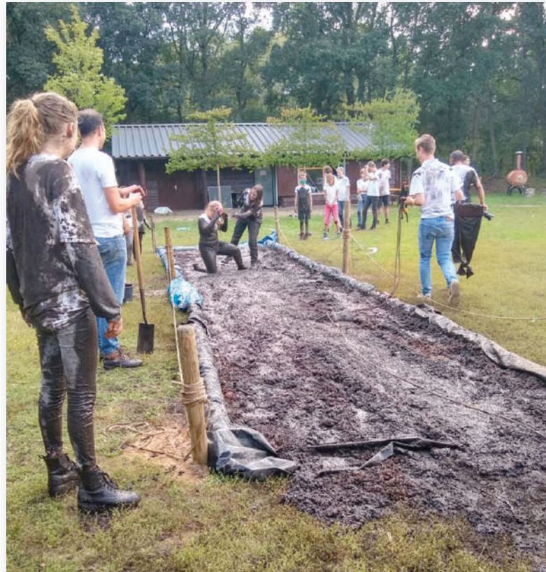
De modderbaan, onderdeel van het militaire trainingskamp tijdens de opening van het nieuwe scoutingseizoen.

Scouting St. Patrick hoopt dat het dit jaar een regulier scoutingseizoen kan draaien waarbij iedereen weer leert, plezier beleeft en gezond blijft. En dat het motto 'Laat je uitdagen' weer van toepassing is voor de meer dan 90 leden die wekelijks in teamverband leerzame actieve activiteiten doen. De activiteiten worden begeleid door meer dan 35 vrijwilligers. Lijkt het je ook leuk om op de scoutingmanier uitgedaagd te worden, als jeugdlid, leiding of vrijwilliger, kijk dan voor meer informatie op de website www.sint-patrick.com of neem contact op via info@sint-patrick.com .