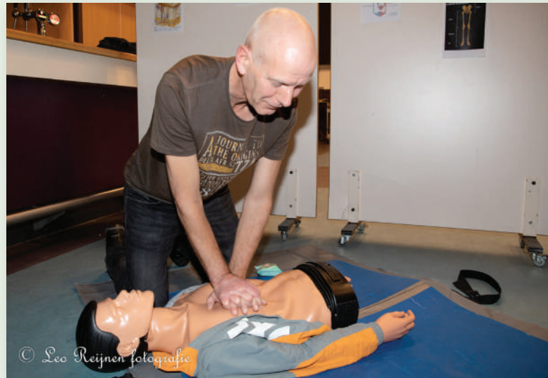
Het Zwaluwstaartje organiseert regelmatig praktijklessen.

"Dit kan vele redenen hebben. Mensen die meer kennis willen hebben van EHBO, ouders die hun kind de eerste hulp willen kunnen bieden, mensen die ooit bij een situatie terecht zijn gekomen en niet wisten wat ze moesten doen, of mensen die