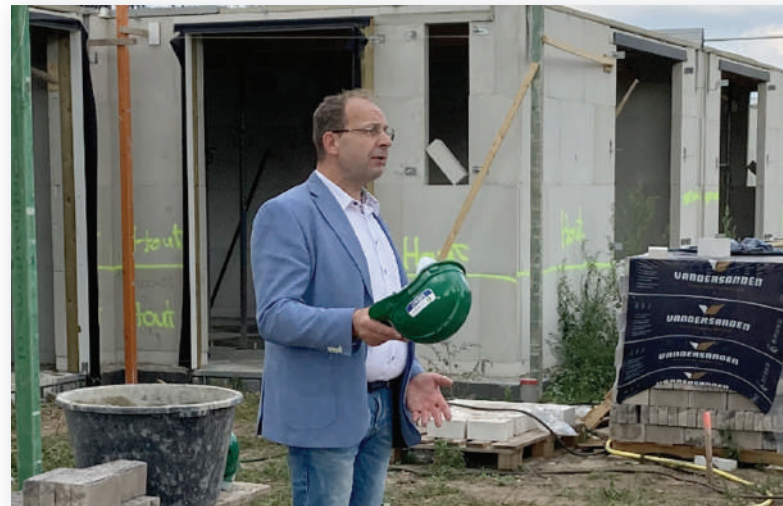
Wethouder Bollen spreekt de aanwezigen toe en benadrukt het belang van Bouwen in de gemeente Sint Anthonis.

aldus een enthousiaste wethouder die ook zelf symbolisch zijn steentje bijdroeg aan de bouw.