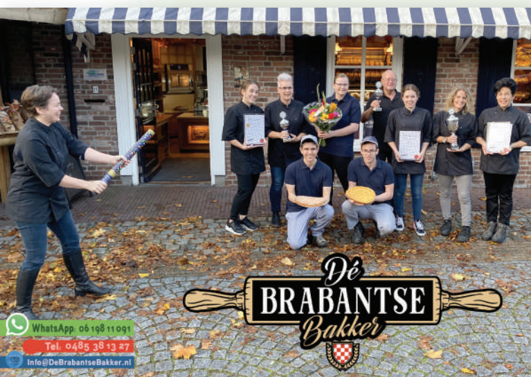
Het team van Dé Brabantse Bakker.

Sinds 1793 is de oudste bakkerij van Sint Tunnis gevestigd aan de Lepelstraat. In de laatste decennia is deze bakkerij meermaals van eigenaar gewisseld, maar het dorpse karakter is door de eeuwen heen behouden gebleven.