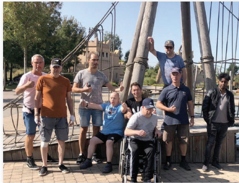
De mannen van De Merret en enkele vrijwilligers bij Toverland.