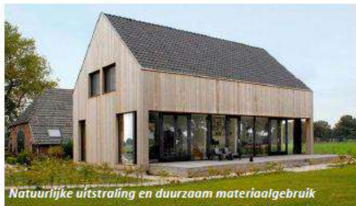
Natuurlijke uitstraling en duurzaam materiaalgebruik