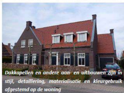
Dakcapellen en andere aan- en uitbouwen zijn in stijl, detaillering, materialisatie en kleurgebruik afgestemd op de woning