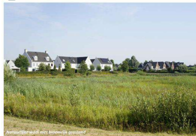
Natuurlijke wadi met bloemrijk grasland