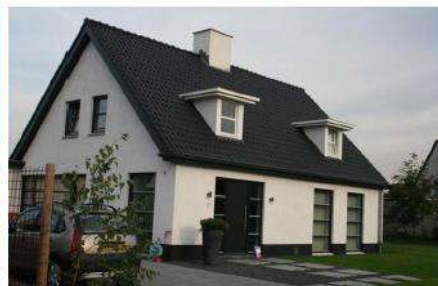
Stucwerk in een wit dan wel grijs tint en gekeimd metselwerk in wit en grijs tinten behoren tot de mogelijkheden