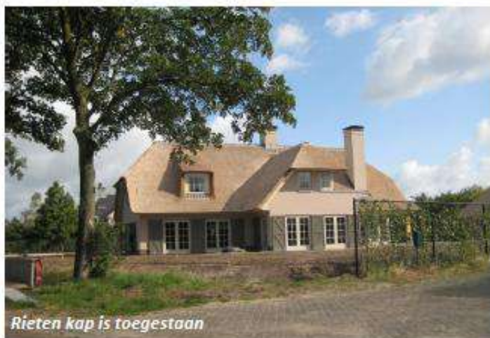
Rieten kap is toegestaan