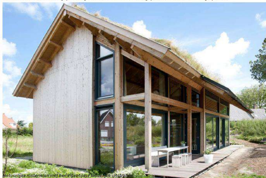
Natuurlijke materialen met een eigentijdse landelijke uitstraling