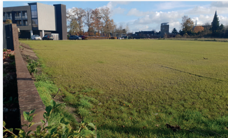
De locatie van de nieuwe AH-supermarkt is nu ingezaaid met gras.

De projectontwikkelaar erkent dat de daadwerkelijke bouw later zal beginnen, omdat de Raad van State de aanvullende informatie moet beoordelen en goedkeuren. Hij wijst op de drukte bij bestuursrechter. “Wanneer het wordt behandeld? Misschien over drie maanden, maar misschien ook wel over een half jaar of een jaar. Dat is moeilijk te zeggen.”